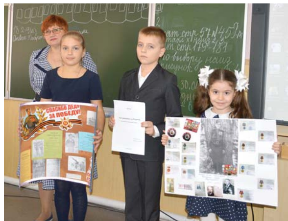
(на фото: Ученики 2-го класса с учителем в ГБОУ «школа №2057» (шо-2))