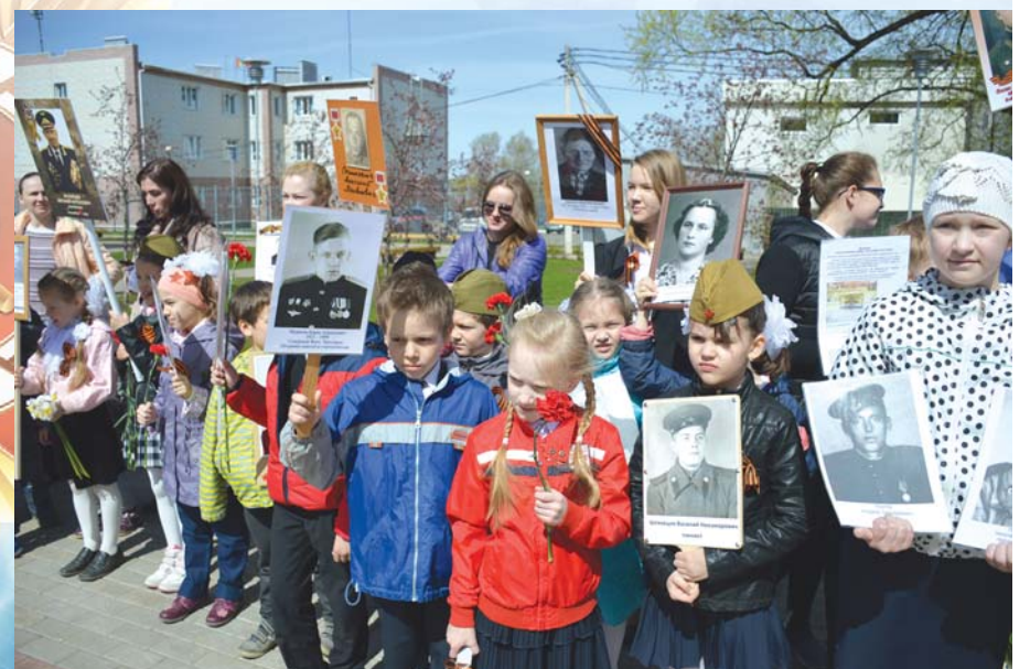
(на фото: участники акции «Бессмертный полк» в поселении Марушкинское)